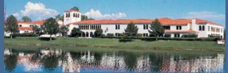
FOREVER LIVING CORPORATE PLAZA